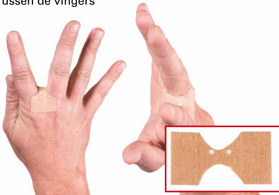
Tussen de vingers