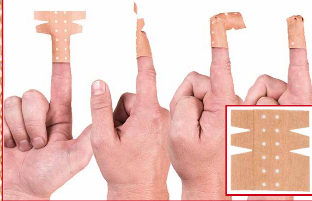
Over de vingertop